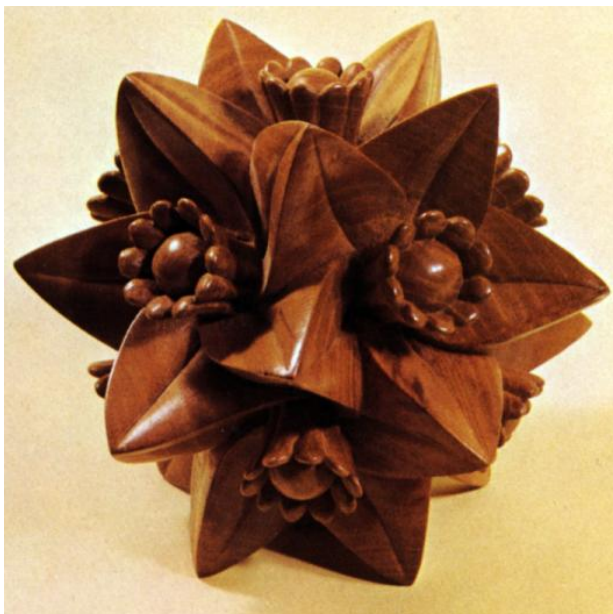
VEELVLAK MET BLOEMEN (1958) Het mooiste driedimensionale object dat Escher gemaakt heeft

De fraaiste sneed hij in 1958; VEELVLAK MET BLOEMEN. Deze stijgt uit boven het bewerken van de oppervlakte van een regelmatig lichaam ofschoon het uitgangspunt bestond uit vijf elkaar doordringende tetraëders. Het is omgetoverd in een handvol prachtige bloemen.