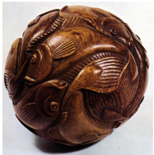
Bol met vissen (1940)

Hier zijn drie voorbeelden van driedimensionaal werk van Escher. Bij gelegenheid van het 75-jarig bestaan van de Verenigde Blikfabrieken (VERBLIFA) vroeg men Escher om een ontwerp te maken dat als relatiegeschenk gebruikt kon worden. Het moest iets origineels worden. En het werd origineel: een blikken koektrommel in de vorm van een icosaeëder (een regelmatig twintigvlak) beschilderd met zeesterren en schelpen en natuurlijk als een regelmatige vlakvulling.