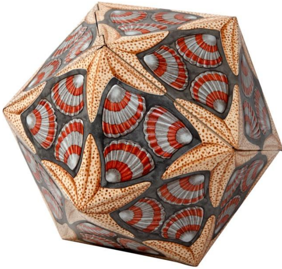
Het koektrommeltje, een relatiegeschenk ontworpen voor VERBLIFA

Ofschoon er een redelijk aantal exemplaren werden vervaardigd, is het nog steeds een gewild en prijzig object voor iedere verzamelaar.