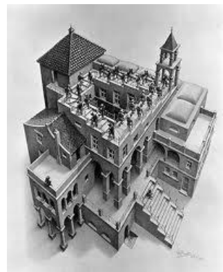
Klimmen en dalen

alle Escher werken en teksten © M.C. Escher Foundation