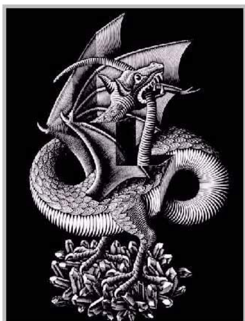
DRAAK, houtgravure (1952), M.C. Escher © M.C. Escher Foundation

Op het eerste gezicht is dit een gewone afbeelding van een draak. Er is echter meer te zien: In het midden is een snee in het platte vlak aangebracht en de staart van de draak is daar doorheen getrokken. Het is een uitbeelding van : “het lijkt een draak, maar toch is het plat.”