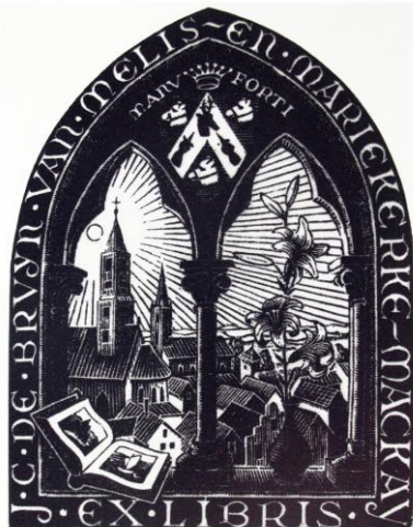
Ex-Libris, juni 1946