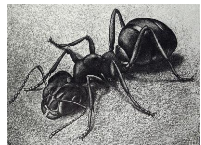
Mier, mei 1943

Bekijk eens de kleine prent LARIKS uit 1961 en de MIER uit 1943. Men herkent meteen de hand van een vakman, maar ziet U er een Escher in? Of in bijvoorbeeld in de Ex Libris uit 1946, ongetwijfeld een knappe houtsnede. Zulke prenten heeft Escher genoeg gemaakt, maar daarin komt niets tot uiting van de kern van Escher's kunstenaarschap: het in beeld brengen van ideeën die hem intrigeerden en de verwondering die hij bij zijn toeschouwers wilde wekken. Dat was immers zijn bedoeling... en niet "het mooie plaatje".