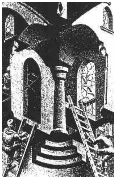
Compositie: Bruno Ernst

Hol en Bol is een knappe prent, waarin U lang kunt ronddwalen voor steeds nieuwe ontdekkingen die automatisch in Uw hersenen gegenereerd worden.