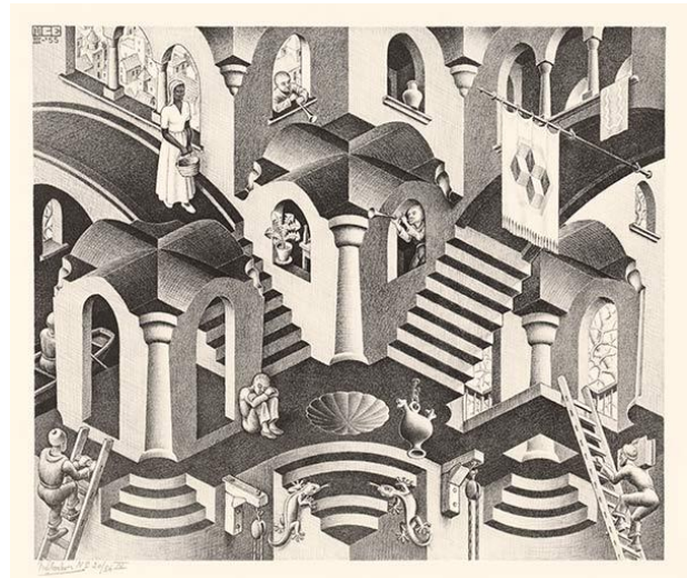
Litho van M.C. Escher: Hol en Bol