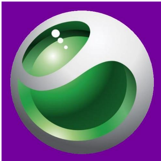
Figuur 2 Geheimzinnige Bol Logo Sony Ericsson

Dit werk is niet geconcipeerd vanuit een wiskundig principe: de ARS staat voorop en de MATHESIS was onbewust een middel om met eenvoudige middelen een maximale expressie te bereiken. Meer over Hans Innemee's werk kunt U met Google vinden.