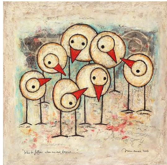
Figuur 1 De weg kwijt? Hans Innemee

U kunt er zelf een ander gesprek bij verzinnen. De plaats van de punten (ogen) en van de snavels zijn uitnodigend genoeg.