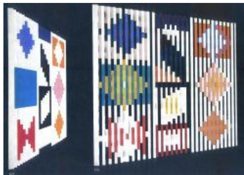
Figuur 3. Twee aanzichten van Pace of time

Dit verklaart echter nog niet het bijzondere karakter van zijn werk, waarin elk rustpunt vermeden is. Hij ontwierp fonteinen met lichtspel, maakte massale kinetische objecten.