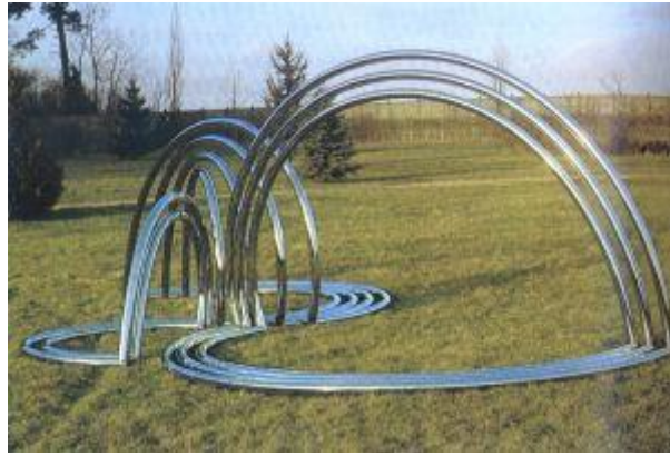
Figuur 4. Beating heart (transformable sculpture)

Zijn uitleg daarvan in zijn CREDO is voor mij, na vele malen herlezen, onbegrijpelijk. Als ik er wat uit kan destilleren zou ik het omschrijven met de aan de Griekse filosoof Heraclites (zesde eeuw v. Chr.) toegeschreven woorden Panta rhei : alles stroomt ofwel alles verandert voortdurend.