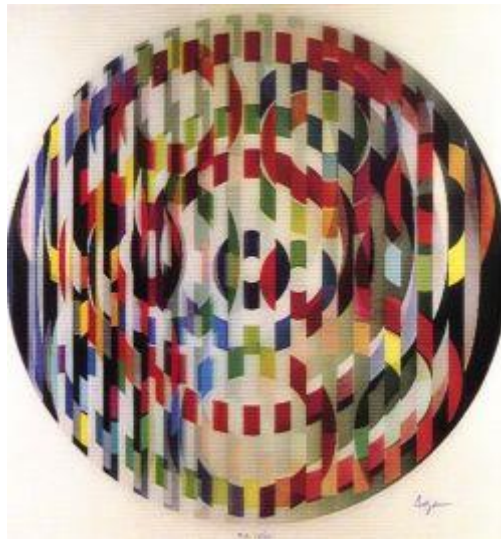
Figuur 5. Festival

Zijn uitleg daarvan in zijn CREDO is voor mij, na vele malen herlezen, onbegrijpelijk. Als ik er wat uit kan destilleren zou ik het omschrijven met de aan de Griekse filosoof Heraclites (zesde eeuw v. Chr.) toegeschreven woorden Panta rhei : alles stroomt ofwel alles verandert voortdurend.